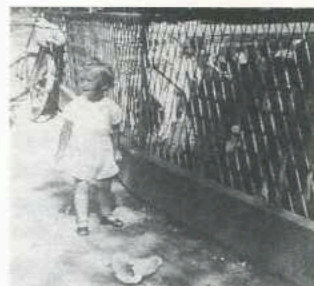
Hanneke bij de hertjes en met moeder, zomer 1942