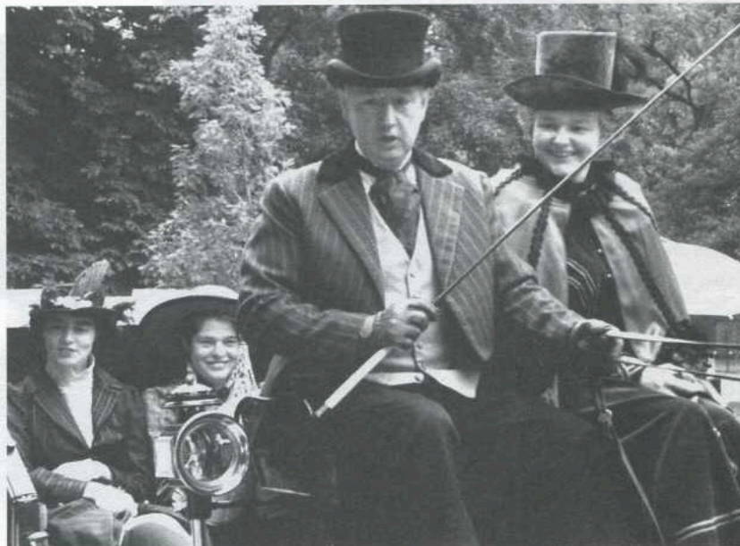
De Vriendendag staat in het teken van nostalgie naar oude sferen. Foto Leven Park 1999

Dus ook de Vrienden die niet zo goed kunnen lopen krijgen de gelegenheid veel van de parken te zien.