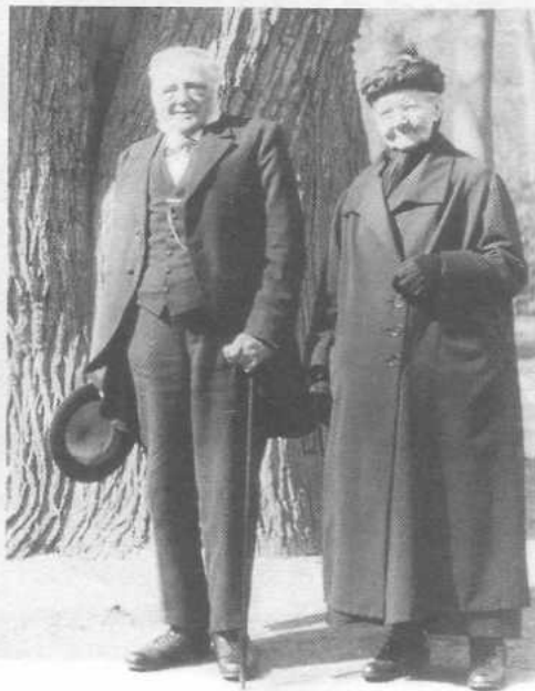
De oude rentmeester met zijn vrouw