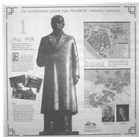
Paneel 1 van "De Arnhemse jaren van Hendrik Antoon Lorentz"

De Lorentz-expositie in Bezoekerscentrum Sonsbeek die in juli werd geopend is na twee verlengingen eind december 2003 definitief voorbij. Zoals het er nu naar uitziet, komen in de loop van volgend jaar de Arnhemse jaren van deze beroemde nobelprijswinnaar in boekvorm op de markt.