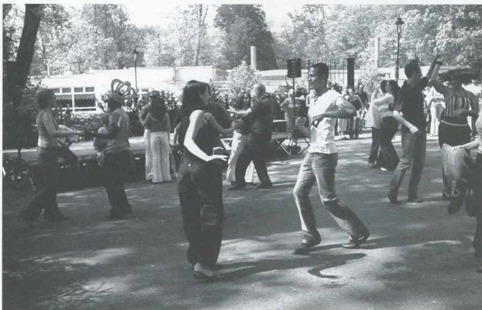
foto voorpagina: wandelen op de Tellegenlaan, koninginnedag. Deze foto: salsademonstratie in de Steile Tuin, koninginnedag