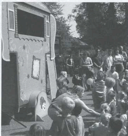
Poppenkast op de Hartgersberg, koninginmedag

Hebt u de laatste tijd vreemde geluiden gehoord in het park, dan was dat vast van de dansschool die twee maal per dag een voorstelling gaf aan scholen in Arnhem. Het planetenstelsel is terug in de koude vijver. Laten we hopen dat het compleet en onbeschadigd blijft. Het 'hondenstrandje' is aangevuld met zand en grond. Er wordt veelvuldig van dit strandje gebruik gemaakt: het is ook de enige plek waar honden het water in mogen.