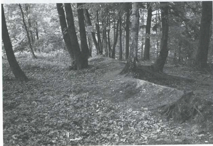
Restanten van de wildgraaf in park Gulden Bodem

Wildgraven komen op een groot gedeelte van de hoge zandgronden in Nederland voor. De term wildgraaf zorgt voor verwarring. Het gaat hier niet om een beheerder van het wild maar om een aarden wal. Andere termen die gebruikt worden zijn wildkering en wildwal. De wildgraaf moest het wild, zwijnen en herten die de veldgewassen ernstig beschadigden, van de akkers weren. Aan de kant van de woeste gronden werd een greppel gegraven. Aan de kant van de akkers werd een wal opgeworpen. Om het hoogteverschil tot 2,5 m op te rekken werd op de wal een hekwerk geplaatst of struweel eiken, meidoorn of sleedoorn geplant.