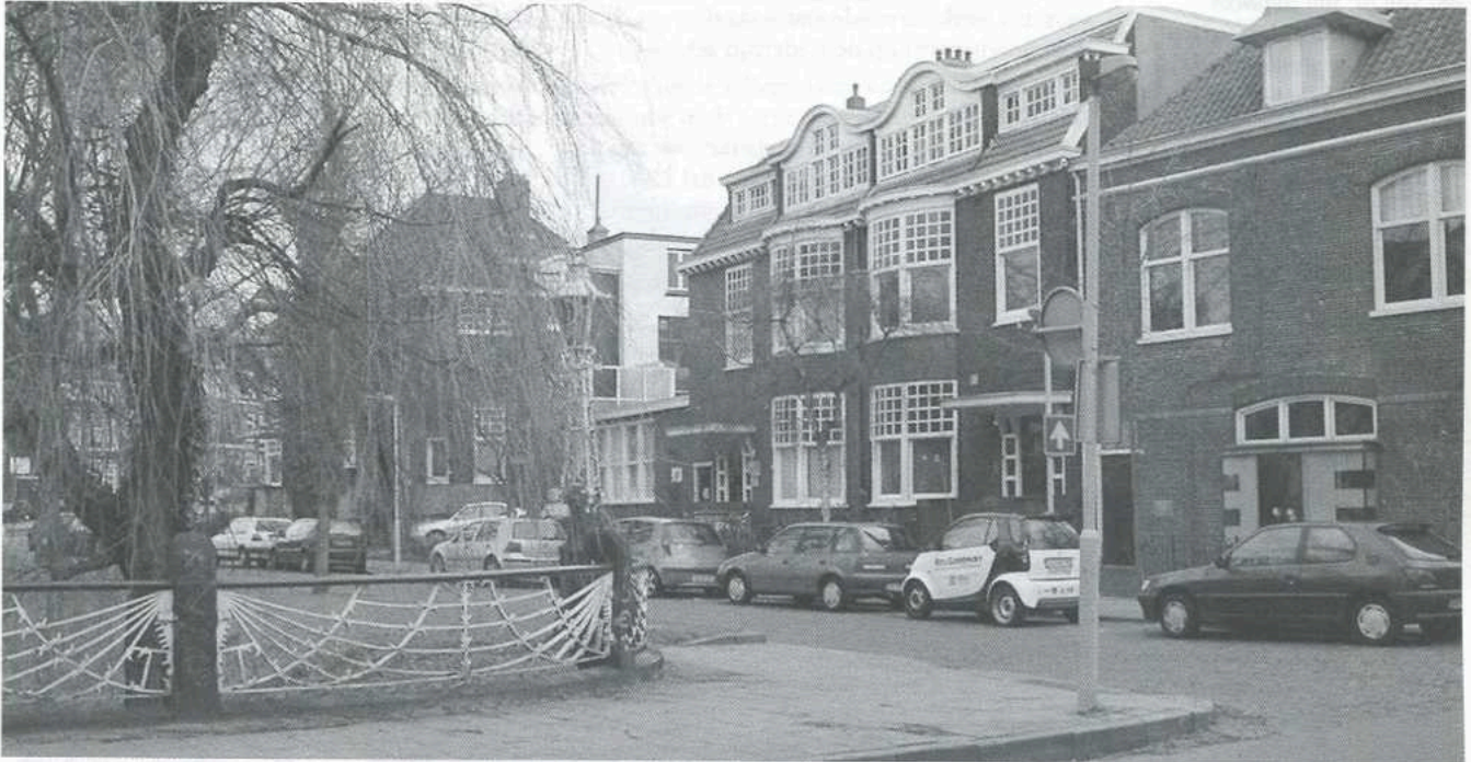
Aan het Bothaplein waar eens de eerste St.Jansmolen stond