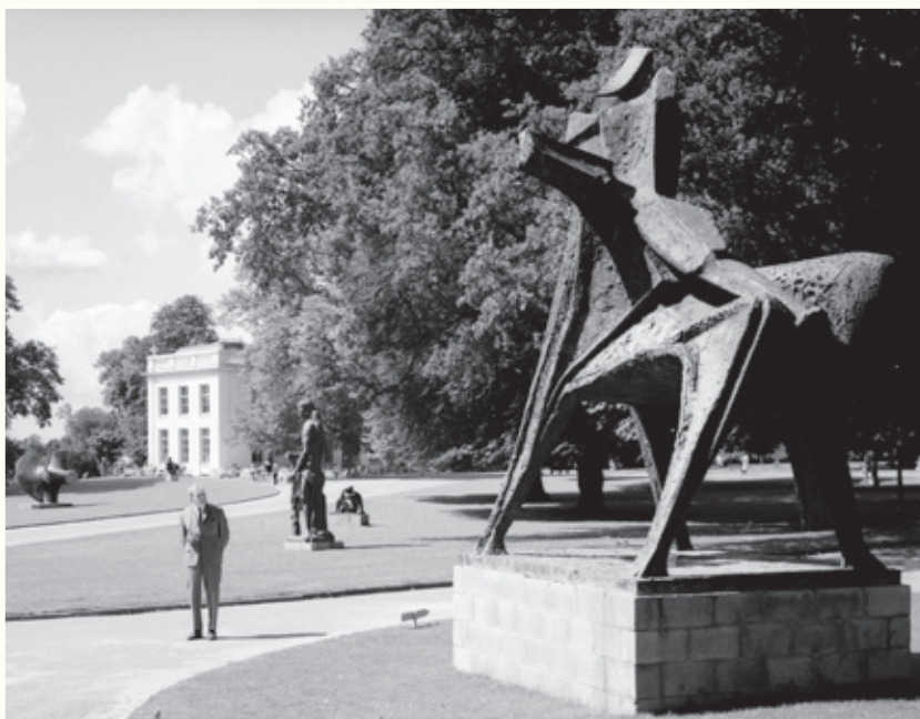
Traditionele opzet van beelden op een sokkel tijdens de internationale beelden-tentoonstelling Sonsbeek '66. Deze 5e editie toonde ten opzichte van de vorige vier een grotere verscheidenheid aan beeldhouwwerken, wat betreft materialen, technieken en stijlen. Op de voorgrond het beeld 'Ruiters' van Marino Marini.

De 'roaring seventies' zorgden voor een omslag in het denken over kunst in de openbare ruimte. Voor de editie van 1971 werd daarom een vernieuwend concept bedacht: Sonsbeek Buiten de Perken . Voor het eerst werd een professionele directeur aangesteld en hij verklaarde: 'Wij kwamen tot de overtuiging dat we niet meer moesten vragen om beelden en die vervolgens naar onze smaak neer te