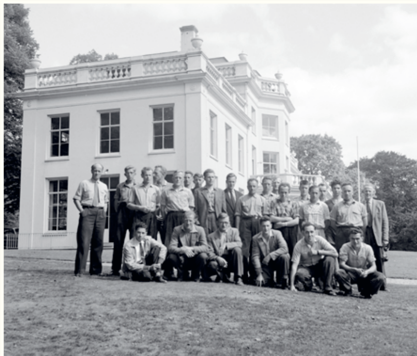
Leerlingen van de Bosbouwschool (ca. 1957/'59).