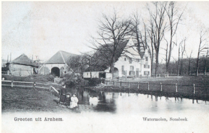
Watermolen met boerderij en beek in park Sonsbeek rond 1920. (Gelders Archief)

Eeuwenoude monumenten, zoals de Witte Watermolen langs de Sint-Jansbeek en de iconische Belvédèretoren die uitkijkt over de stad, getuigen van de rijke historie van het park. Hier, langs de Sint-Jansbeek, begon het verhaal van Arnhem.