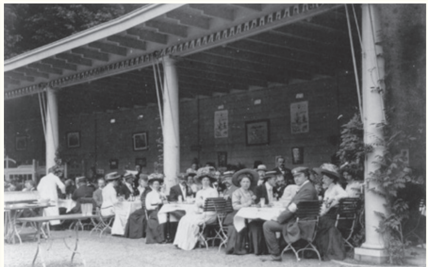
Na aankoop van Sonsbeek werd de villa verpacht als hotel, de rentmeesterswoning als pension en de tuinmanswoning als theeschenkerij. Naast de theeschenkerij werd begin 1910 een veranda gebouwd. De foto toont de gloednieuwe veranda op zondag 17 juli 1910 als deelnemers aan de ANWB-Bondsdagen de lunch gebruiken.

In die periode leek het bijna of Sonsbeek al openbaar park was, want in juli 1895 werd er een vierdaagse landbouwtentoonstelling gehouden en in augustus 1895 was het landgoed open voor een hippisch feest met kermis. In 1896 kregen wandelaars in de zomermaanden toegang tot het park op vertoon van een abonnement, dat ze voor 5 gulden per persoon konden kopen. Zij konden daarmee ook concerten bijwonen. In juni 1896 werd het hele park van 50 hectare te huur aangeboden. In 1897 boden de villa, de orangerie en de hertenkamp plaats aan een grote nijverheidstentoonstelling. Echt openbaar kon je dit park nog