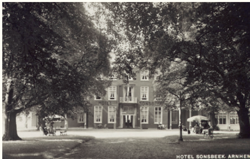
Hotel Sonsbeek, circa 1935.

Na de oorlog wordt het pand gerenoveerd en herbestemd tot schoolgebouw. De opleidingsschool van de Heidemij werd op 3 mei 1957 geopend. Jonge bosbouwers krijgen hier hun opleiding in een passende, groene omgeving. Na het verlaten van de Bosbouwschool, gebruiken de Sonsbeek Scholengemeenschap en de Lorentz Scholengemeenschap het pand tot in de jaren tachtig als dependance. Tot op de dag van vandaag zijn er in de Stadsvilla nog steeds reünies van oud-scholieren.