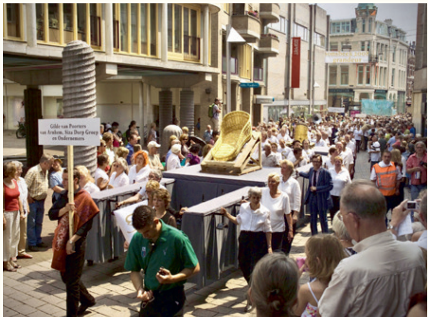
In een processie met draaggilden wordt het kunstwerk Bakermat van Johan Creten door de stad gevoerd tijdens de 10e editie in 2008: Sonsbeek Grandeur. Het werk van Creten bestaat uit een gevlochten bakermat en drie bijenkorven. Tijdens de Sonsbeektentoonstelling leefden in de goudkleurige bijenkorven ongeveer 150.000 bijen. Het werk is aangekocht en te zien in de Stille Vijver.