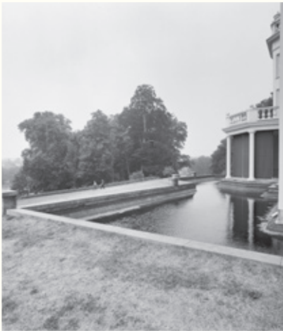
Stadszijde van huis Sonsbeek, erker met vijver. Foto: G.J. Dukker, 1999 (Rijksdienst Cultureel Erfgoed).