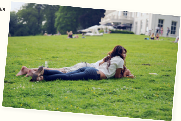
Weide bij Stadsvilla Sonsbeek. mei 2012.