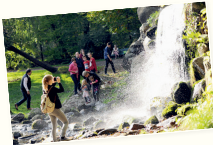
Grote Waterval in Sonsbeek. Foto: Marco Derksen/Flickr, oktober 2014.

Deel met ons een foto van jouw bijzondere plek. Dat mag een nieuwe foto zijn, maar ook een foto 'van toen'. Leg in maximaal honderd woorden uit waarom de gefotografeerde plek voor jou zo bijzonder is. Inzenden is mogelijk vanaf nu tot en met 21 juli 2024. Een deskundige jury zal alle inzendingen beoordelen en komen tot een shortlist van inzendingen. Deze foto's zullen na de zomer worden geëxposeerd in het Nederlands Watermuseum en bezoekerscentrum Molenplaats Sonsbeek. Daarnaast zullen er per categorie winnaars worden benoemd. Er zijn twee leeftijdscategorieën en met name jongeren worden ook uitgenodigd deel te nemen!