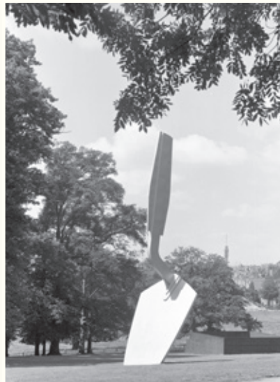
De 'Troffel' van Claes Oldenburg tijdens Sonsbeek Buiten de Perken in 1971. Het zilverkleurige beeld was destijds in uitvoeringskosten het duurste werk van de expositie. Het is herplaatst bij Kröller-Müller Museum en sinds 1976 (na overleg met de kunstenaar) blauw geverfd.

Lazy King van Alain Séchas op de weide voor de Stadsvilla (Sonsbeek 2008: Grandeur)