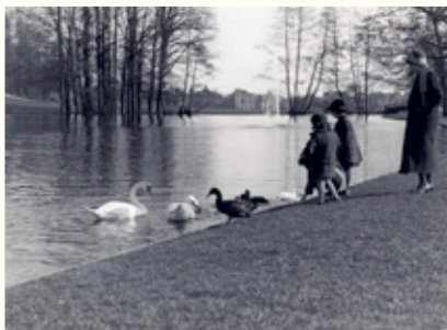
Lente in Sonsbeek in 1926 bij de Fonteinvijver.

Sinds 1963 is het park een Rijksmonument. De parken Sonsbeek, Zypendaal en Gulden Bodem vormen de groene parel van Arnhem, waarvan vele bezoekers van binnen en buiten de stad in alle seizoenen genieten.