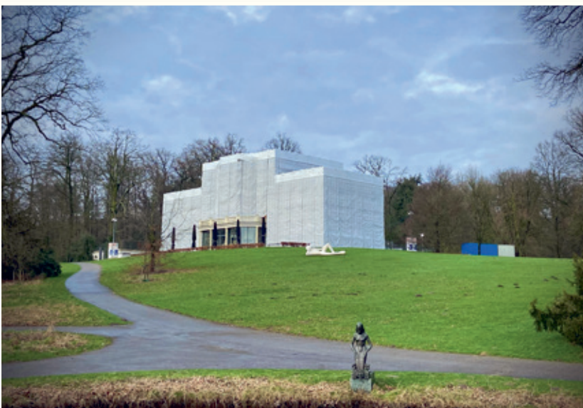
Stadsvilla Sonsbeek, ingepakt in steigerdoek (februari 2024).

In 1987 verkoopt de gemeente het inmiddels uitgeleefde huis aan een groep projectontwikkelaars. Zij restaureren het pand en vestigen er in 1989 het Sonsbeek International Art Center (SIAC). Omdat er kostbare kunstwerken worden geëxposeerd, wordt er op laste van de verzekeraar een stevig hekwerk en een betonnen waterbak om het pand gelegd. Ook wordt een losstaand ketelhuis gebouwd op de plaats van het vroegere koetshuis,