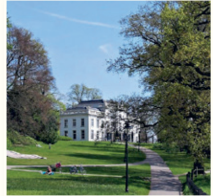
Voorstel om pad te verleggen

Om meer mensen op te vangen is het nodig bezoekers meer te verspreiden over de parken. Strootman denkt daarbij aan het verbeteren van de toegankelijkheid en het 'ontwikkelen van nieuwe bestemmingen' op plaatsen waar nu weinig mensen komen. Uiteraard wordt ook geadviseerd meer slijtvastheid te realiseren op plaatsen waar het nu druk is en het altijd druk zal blijven. Het park mag echter geen eenheidsworst worden. De visie noemt vier 'parksferen' met elk een eigen inrichting en een eigen