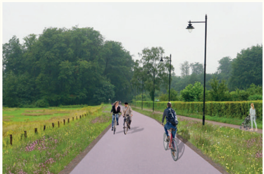
Impressie van de Parkweg als autoluwe parkway

bijdrage aan de klimatologische uitdagingen. Allereerst is daar het dal rond de beek. Daar overheerst de tuinhistorische waarde van het park. Intensief onderhouden perken, paden, bouwwerken en cultuurelementen bepalen het beeld. Toch draagt ook dit klassieke wandelpark bij aan de klimaatdoelen: in de graslanden krijgen meer plantensoorten een kans en de oorspronkelijke grondwaterspiegel