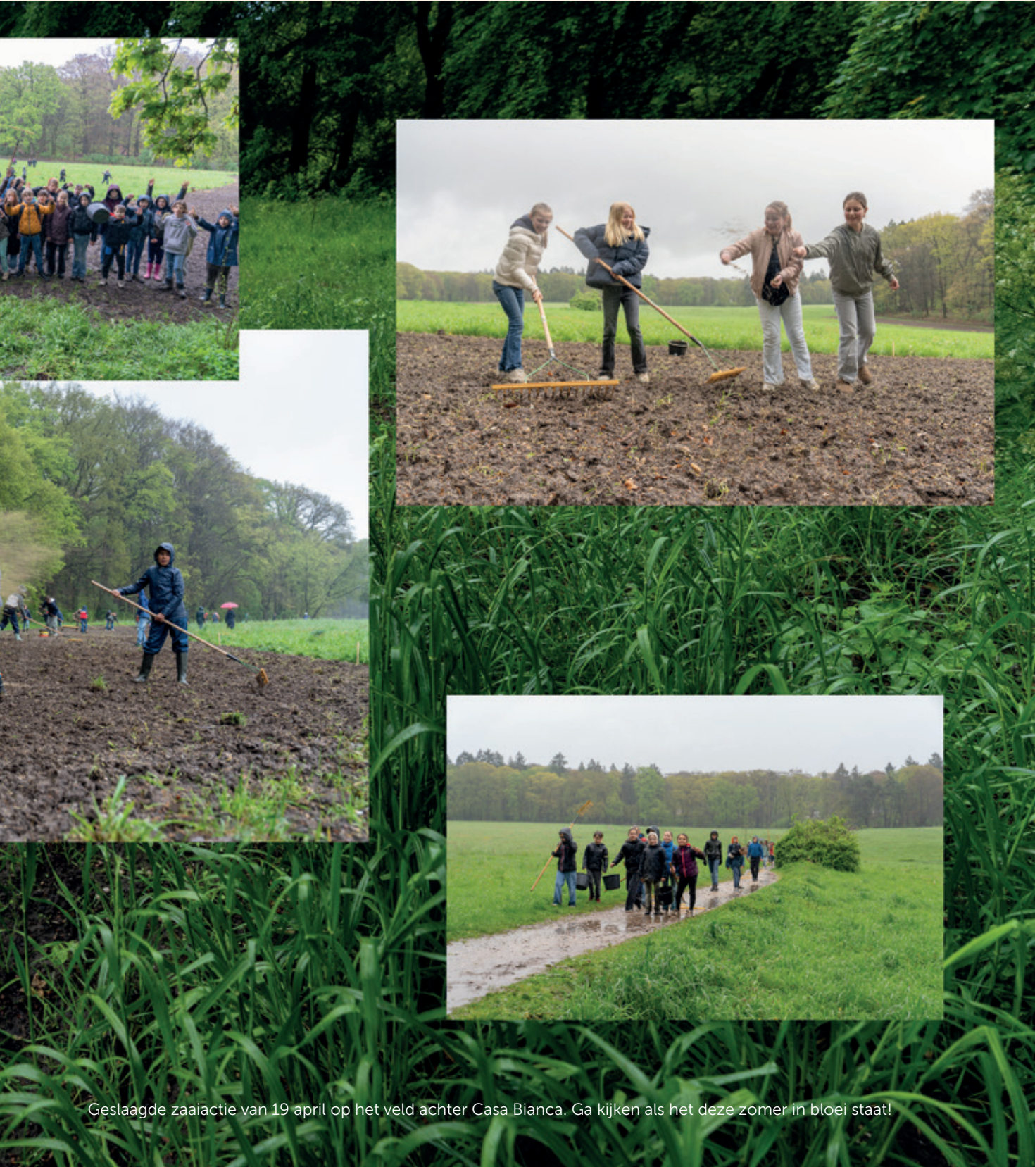
Geslaagde zaaiactie van 19 april op het veld achter Casa Bianca. Ga kijken als het deze zomer in bloei staat!