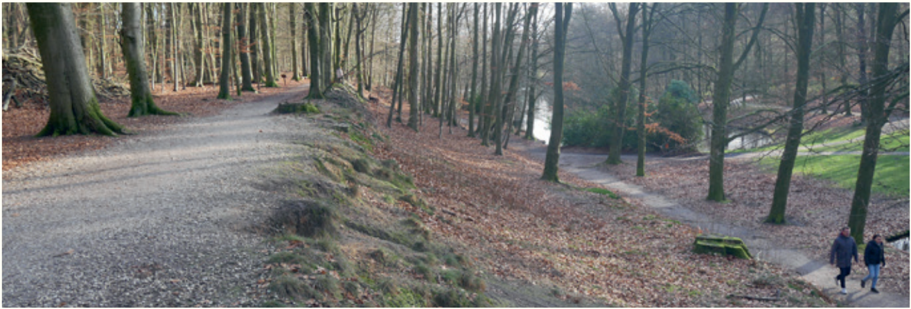
Herstel barokke terrassenlaan

wordt hersteld. Aan het beekdal grenst het parkbos. In deze 'sfeer' is de hand van de mens als architect van de bomenpartijen duidelijk zichtbaar. In deze architectuur wordt ingezet op meer (bio)diversiteit door het aanplanten van meer soorten droogtebestendige boomsoorten. In het parkbos blijven omgevallen bomen niet liggen. In de derde 'sfeer' het bos, is dat anders. Daar is de natuur meer de baas en moet de huidige overheersing van de beuken plaatsmaken voor een meer natuurlijke afwisseling van boomsoorten. De biodiversiteit wordt verder vergroot door verbetering van de bosranden en het leven in de bosbodem. De laatste 'sfeer' in de visie is de landschapskamer. Oude landbouwgronden die een gevoel van ruimte geven en wijzen op de gebruiksgeschiedenis van het park. Vee blijft daar een onderdeel van, maar lage heggen en meer diversiteit in de vegetatie krijgen een plaats. Zij maken het historische beeld meer kloppend en verhogen opnieuw de diversiteit. Op deze wijze kan bij zware buien ook meer water worden opgevangen in deze zones.