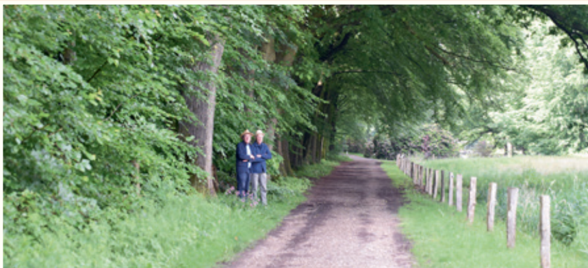
Cederallee, mei 2024

Mei 1924. Twee oude heren met zomerhoed poseren bij hetzelfde rijtje Amerikaanse eiken dat omstreeks 1908 werd geplant. Op de voorgrond staat een rij jonge lindes, ongeveer vijftien geleden geplant. De rollen zijn omgedraaid. Juist voorbij de knik in het pad richting Kluiseweg doet het dilemma zich opnieuw voor. Van de rij oude beuken zijn er al heel wat geveld, sommige zijn stervende. Wat te doen?