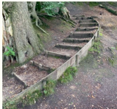
Herstel versleten elementen zoals trappen

In de visie wordt onderscheid gemaakt tussen drie soorten projecten: beheersmatige-, éénmalige- en top-projecten. Die laatsten kunnen onze parken extra uniek maken. Het gaat om het herstellen van historische lanen (zoals de Cederallee), realisatie op de Gulden Bodem van een object