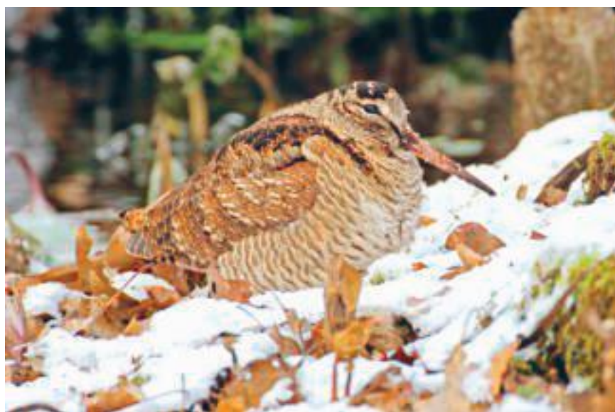
De houtsnip werd in park Zypendaal gesnapt.

Op waarneming.nl ontdek je dat vrijwel alle in Zypendaal en Sonsbeek gemelde houtsnippen uit deze vorstperiode komen. Waarnemer Ruben Vermeer telde in Sonsbeek in korte tijd zelfs achttien exemplaren met de toelichting: 'Over het hele park, vlogen alle kanten op'. Ook watersnip en bokje blijken met name toen te zijn waargenomen.