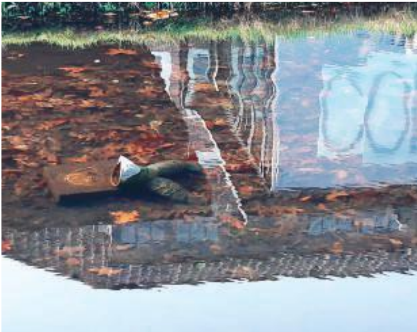
De duikende kikker in de beek bij het Watermuseum, waarvan alleen de achterpoten gewoonlijk boven het water uit steken, is omgetrokken.

Zie voor de waterspreeuw ook onze achterpagina.