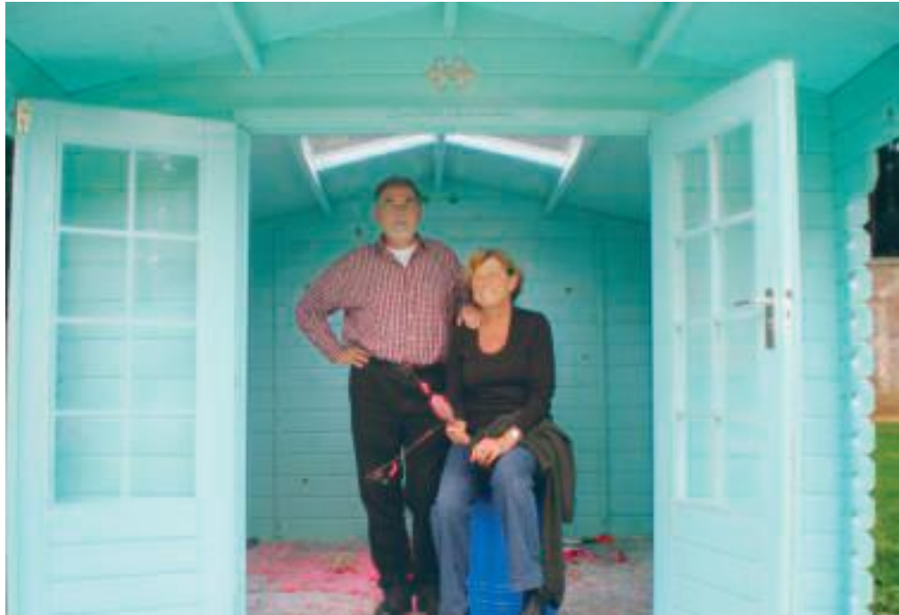
De schrijver van bijgaand verhaal met zijn echtgenote in een huisje dat tijdens de expositie van 2008 in de Steile Tuin was opgetrokken.

'Sonsbeek buiten de perken' brak in 1971 radicaal met de traditie van ambachtelijke beelden op een sokkel in het park. De jaren zestig waren voorbij, een nieuwe generatie kunsthistorici was aangetreden. Een generatie met gevoel voor nieuwe internationale ontwikkelingen in de kunst: popart – zoals de metershoog uitvergrote troffel ('Trowel1') van Claes Oldenburg; landart – zoals de door Robert Smithson ontworpen landafgraving in een stadsuitbreiding van