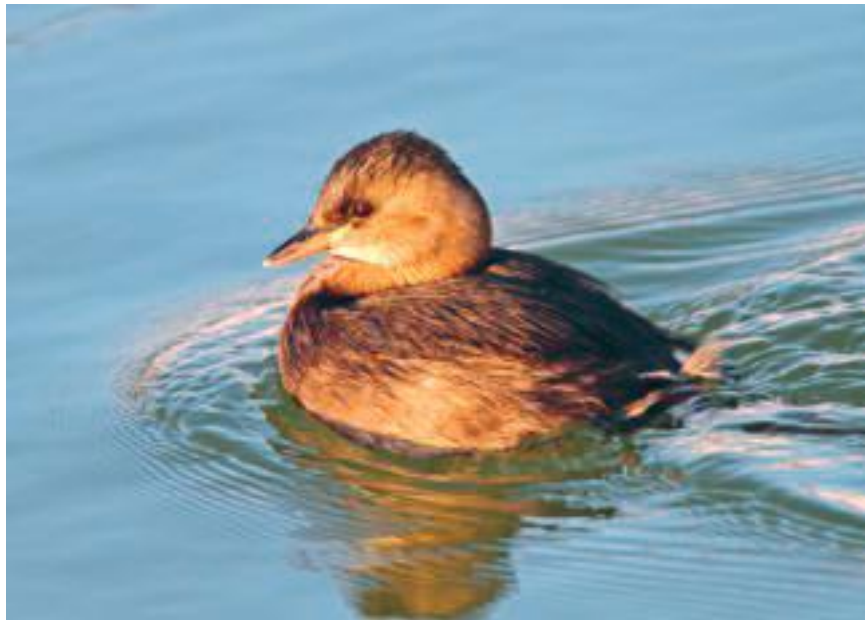
De dodaars, familie van de fuut.

We voeren als waarnemer elke waarneming van een exemplaar of een groepje dat we hebben gezien of gehoord afzonderlijk in. Dus een grote gele kwikstaart bij Molenplaats en een exemplaar dat we tien minuten later waarnemen bij de Grote Waterval melden we apart.