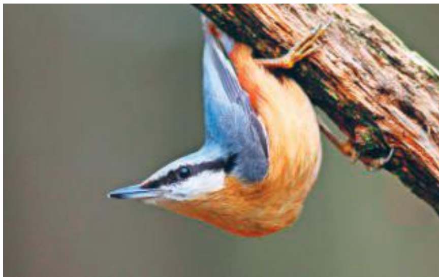
Deze boomklever gaf zich bloot in park Sonsbeek.

Voor vogelaars is de bij vorst toememende kans op het betrappen van niet zo vaak gesignaleerde snippen langs de sprengbeekjes spannend. Houtsnip, watersnip en bokje zoeken met hun lange snavel voedsel in een vochtige bodem. Is het echt koud dan zoeken zij vorstvrije kwelplekken op. Daar fotografeerde ik op 5 februari 2012 op Zypendaal bij ongeveer min 8 de hierbij afgebeelde houtsnip.