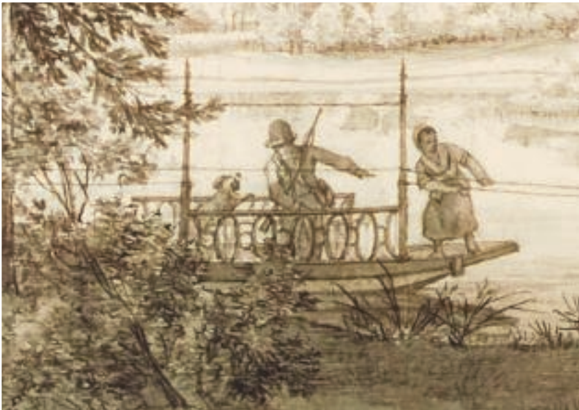
Chinees trekpontje op de Grote Vijver van Sonsbeek (1814), D.J.T. Kerkhoff.

Laat bij een echte Ernhemmer de woorden Chinees en Sonsbeek vallen en hij zal je verwijzen naar het Sonsbeek Paviljoen. Dat huisvest sinds 1988, dus al meer dan 30 jaar, een Chinees specialiteitenrestaurant. Zeg diezelfde woorden tegen een tuinhistoricus en hij denkt in de eerste plaats aan het zogenaamd Chinese trekpontje dat twee eeuwen geleden sporen trok in het water van de Grote Vijver.