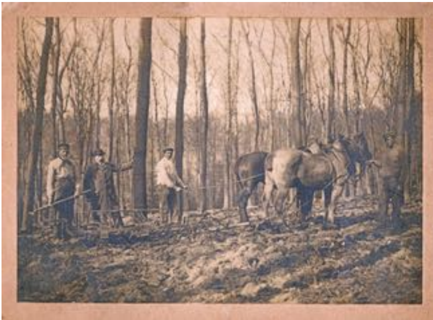
Grondbewerking met de rol-egge in het bos van Sonsbeek.