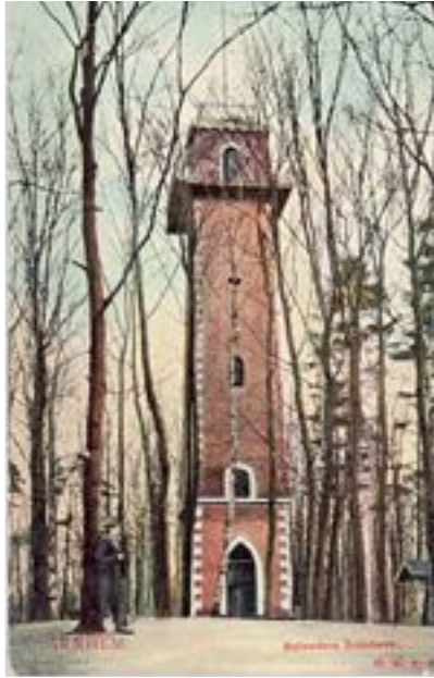
Prentbriefkaart Belvédère uit 1910.

Twee jaar later komt de van zijn dagboeken bekende zakenman en dichter Willem de Clercq naar Sonsbeek. Op 17 augustus 1815 noteert hij over de Belvédère: 'Wij beklommen een soort van berg op de welke een bouwvallige toren zich bevond op wiens top het Panorama verrukkend was.'