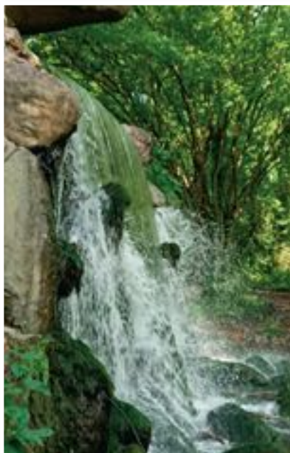
Stilte en geluid, daar kun je in Sonsbeek voor terecht. Bijvoorbeeld bij de grote waterval.

Op de scholen werd begonnen met workshops om er met de kinderen achter te komen watvoor geluiden