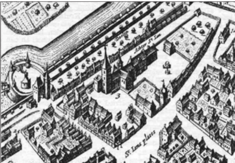
Het gebied van de Commanderij van Sint-Jan, Arnhem rond 1650. Nu Jansplein - Jansplaats