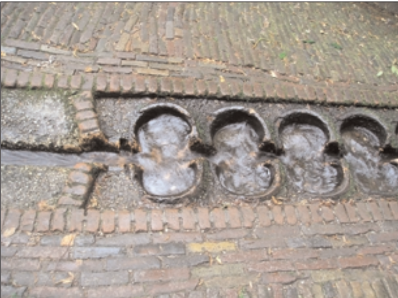
Kommetjeswaterval bij de Hangbrug, Sonsbeek