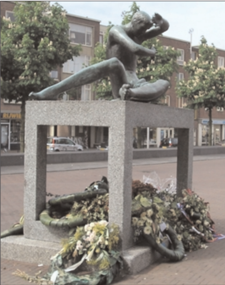
Beeld 'Mens tegen Macht' (Gijs Jacobs van den Hof, 1952). Sinds 1953 Arnhems oorlogsmonument op het Kerkplein.. Maakte daarvoor deel uit van de tentoonstelling Sonsbeek'52.

Wie Hofman in zijn verschillende rollen bij de gemeente heeft leren kennen, weet het antwoord: er moet een vervolg komen, zij het dat er meer garanties nodig zijn voor een goede financiële afloop.