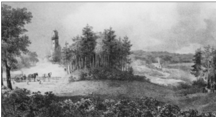
Lariksbosje en Belvédère op litho uit 1845 van Deguerrois, collectie Gemeentemuseum Arnhem

De groep lariksen op de Larikskop is nu bijna 200 jaar oud. Ze hebben zich gevormd tot monumentale exemplaren doordat ze aan de bosrand hebben gestaan. Door de schaduwwerking zijn de onderste takken afgevallen en zijn alleen de koppen van de bomen, bovenaan de lange stammen, nog over. De lariksen van Sonsbeek worden bedreigd door het oprukkende beuken- en eikenbos. Het is opvallend hoe dun de stammen van veel lariksen in Sonsbeek zijn. Dat is het gevolg van de dichte aanplant in de 19e eeuw en het uitblijven van dunningen. Het is belangrijk de lariksen te behouden. Enerzijds vanwege hun band met de geschiedenis van Sonsbeek, anderzijds voor het behoud van de soortenrijkdom van het bomenbestand van het park. Al voor de parkontwikkeling, bij de eerste ontginning van het gebied rond 1790, werden op Sonsbeek in het gebied waar nu de Tellegenbank staat lariksen aangeplant voor bosexploitatie. Misschien staat er op Sonsbeek nog wel een enkele lariks die ouder is dan 200 jaar. In de Grote Vijver zijn bij restauratiewerkzaamheden oude beschoeiingen van larikshout boven water gekomen. Het zal ook de bedoeling van Baron de Smeth zijn geweest om de lariksen die hij heeft aangeplant te