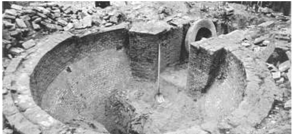
In 1999 werd de ijskelder van Sonsbeek uitgegraven, opgemeten en onderzocht.