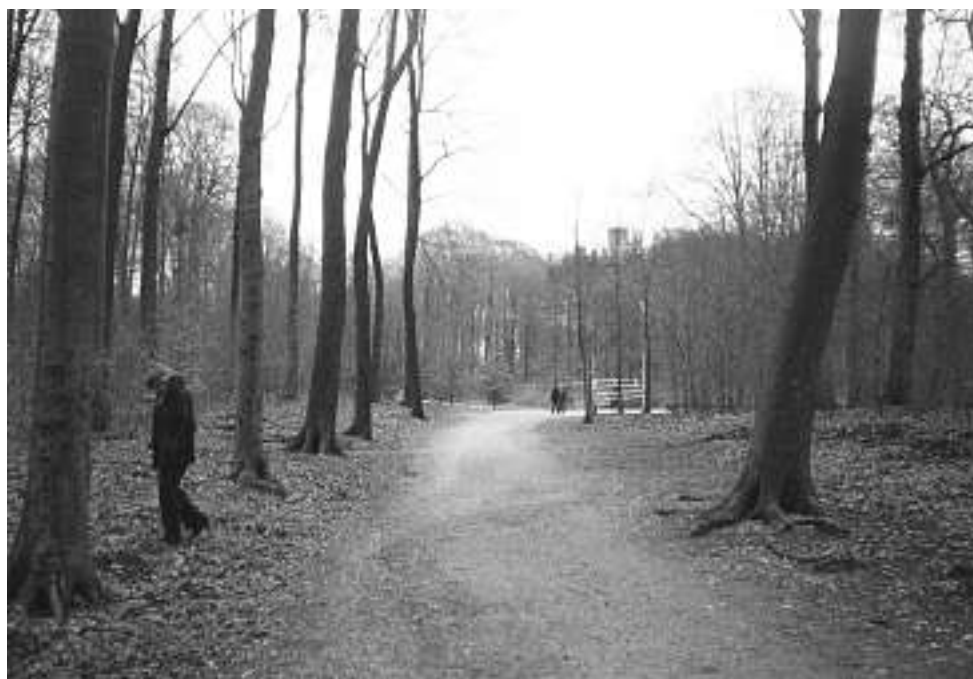
De Franse laan, die loopt van de Tellegenlaan naar de Ronde Weide, is één van de parklanen waaruit in de loop der jaren een aantal bomen is verdwenen waardoor het laanbeeld is aangetast.

Literatuur: Evert Ruiter - De Mandarijneend als broedvogel in Overijssel. Troeteleendje of vreemde eend in de bijt? Uitg. Alcedo Natuurprojecten.