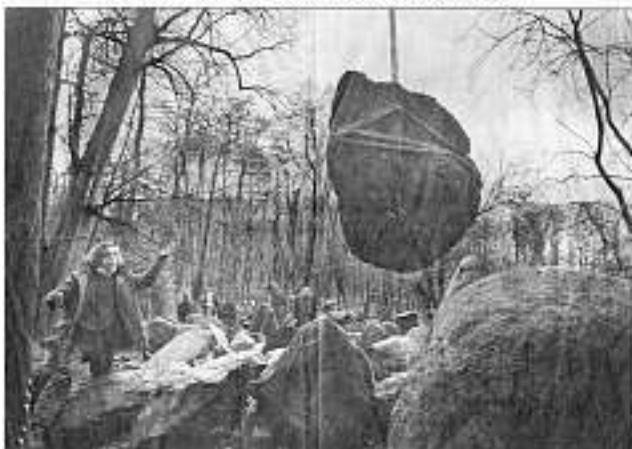
Grote Waterval gaat weer echt klateren

Reproductie van een prachtige actiefoto van Cees Mooij uit De Gelderlander in november 1998: "onder toezicht van assistent-beheerder Jeroen Glissenaar werd het herstel gisteren begonnen. Een 2600 kilo zware kei werd weggetakeld zodat de bodem eronder leklicht kan worden gemaakt." Helaas werd het origineel van de foto in de archieven niet teruggevonden..