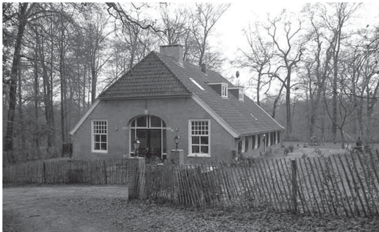
Boerderij Dalzicht in 2005, na de restauratie, weer bewoond

Glissenaar nam zijn intrek in Dalzicht als anti-kraakwacht en betaalde daarom alleen voor het waterverbruik. Een hogere vergoeding was niet terecht geweest want de boerderij verkeerde in een erbarmelijke staat. "Mijn levensritme werd in die jaren zo'n beetje bepaald door het kappen, verzagen en stoken van hout. Als het vuur het hoogst brandde, gingen we boodschappen doen.