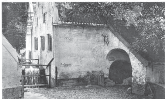
Arnhem. Oude Boerderij Park Sonsbeek.