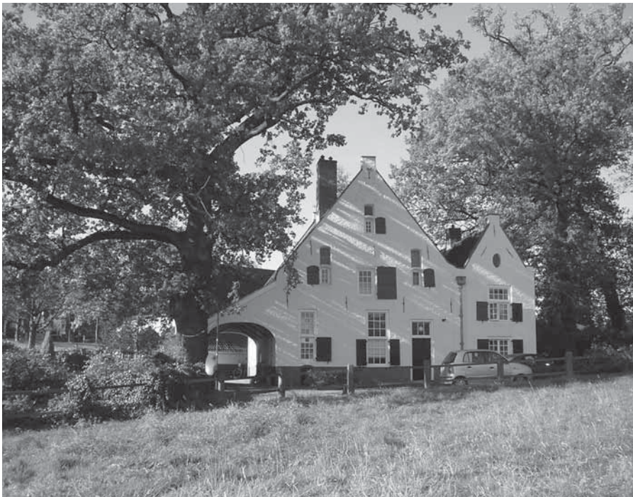
De Witte Watermolen van Sonsbeek.