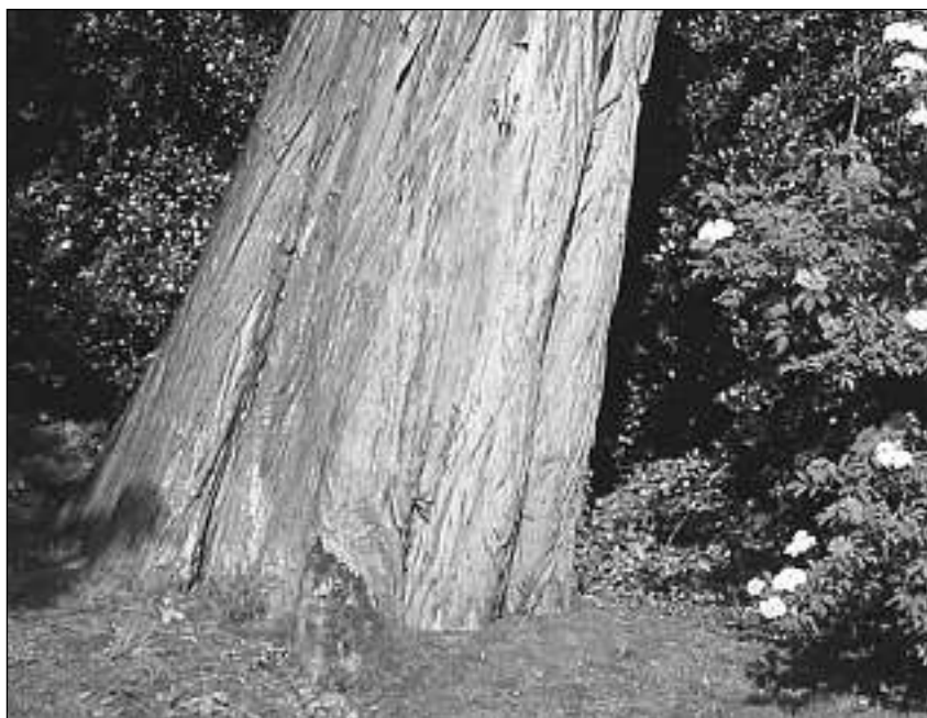
De Moerascypres tegenover het Sonsbeekpaviljoen

boom daar een sprookjesachtige verschijning. Met deze luchtwortels kan de boom ademen en langdurige overstromingen overleven. Het hout is erg duurzaam. De bolle knobbels van de luchtwortels werden door de Indianen gebruikt voor het maken van bijenkorven. Het hout heeft een heerlijke geur. De Moerascypres is familie van de Sequoia, de beroemde reuzenboom uit Californië. Daarvan staan er op Gulden Bodem een paar, recht tegenover kasteel Zypendaal.