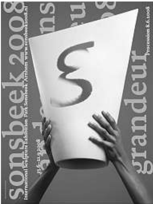
Affiche Sonsbeek 2008.