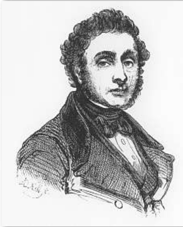
Jan David Zocher jr., portret uit 1842 door A.D.Nett.

Zocher is buitengewoon productief geweest. Het boek vermeldt gegevens van ruim 120 gerealiseerde ontwerpen van Nederlandse buitenplaatsen, begraafplaatsen, parken, bruggen en gebouwen. Veel van die buitenplaatsen en parken zijn heel bekend en bestaan nog steeds. Maar veel van de gebouwen zijn inmiddels afgebroken. Zocher werkt vanaf 1821 in opdracht van Van Heeckeren aan park Sonsbeek. Het was zijn 14e opdracht. Hij had toen al ervaring met stadsparken in Haarlem, Den Haag en Arnhem (in 1817 een park op de geslechte stadswallen dat in 1835 is vervangen door de buitensingel van Aytink van Falkenstein). Later ontwerpt hij stadsparken in Schiedam, Leiden, Rotterdam en ten slotte Amsterdam (het Vondelpark 1864-1877).