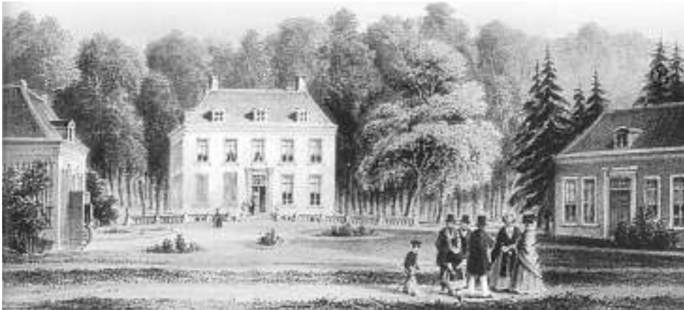
Huis Zypendaal omstreeks 1850.