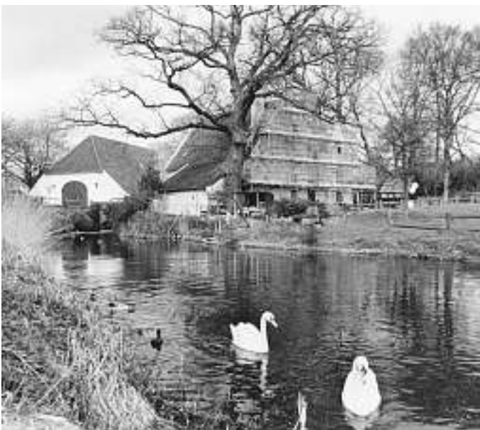
Renovatie van de Witte Watermolen, voorjaar 1998.