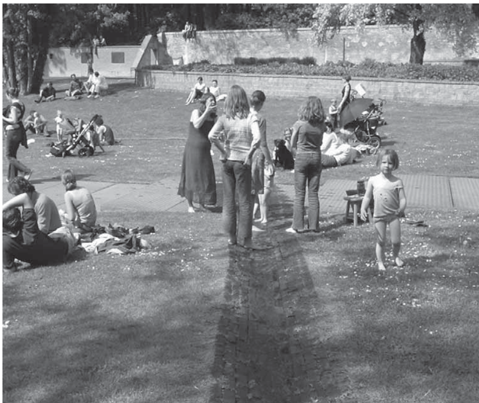
Bezoekers wandelen en spelen in de Steile Tuin (2004) tuinstrips.