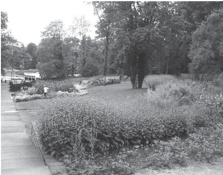
De Steile Tuin, tien jaar na de aanleg. Gezicht naar beneden op de bloeiende rode en geel/witte tuinstrips.

waren van een kwalitatief zeer hoog niveau. Uiteindelijk werd gekozen voor het ontwerp van Wim van Krieken. Wim van Krieken en de zijnen hebben zich laten inspireren door het ontwerp van Copijn. Er zijn, qua hoofdstructuur, duidelijke overeenkomsten tussen beide ontwerpen. Het ontwerp 'Steile Tuin' van Wim is echter rustiger en weidser en past beter bij de Engelse landschapsstijl die kenmerkend is voor Sonsbeek. Juist door de weidse aanpak komt de variatie in bloemen en planten, maar ook het grote hoogteverschil goed tot uiting.