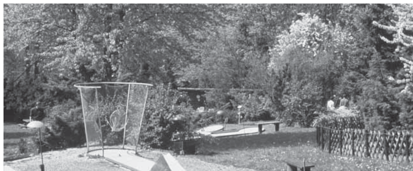
Midgetgolfbaan in de oude tuin (1983)

De plannen werden opnieuw opgepakt bij de restauratie en vernieuwing van het park ter gelegenheid van 100-jarig bestaan in 1999. De aanleg van de nieuwe tuin werd opgenomen in het plan van aanpak. Bureau Copijn, het bureau dat werd aangezocht om de vernieuwing van het park vorm te geven maakte een prachtig ontwerp voor de nieuwe tuin. Dit ontwerp kreeg de naam De Wijntrap, omdat het wijn als thema had. "Volgens de overlevering was er een tijd dat landgoed Sonsbeek z'n eigen wijn had" zo stelde Copijn in de toelichting op het ontwerp. In het ontwerp zijn de centrale as en terrassenstructuur al zichtbaar en tevens is er in de tuin een centrale plek: "een bijzondere wijntafel waarin de flessen Sonsbeekwijn op warme zomerfeesten kunnen worden gekoeld". Onmiskenbaar een geweldig ontwerp, dat het echter niet haalde. De kosten van aanleg waren gewoonweg veel te hoog. Ook was er kritiek op het thema