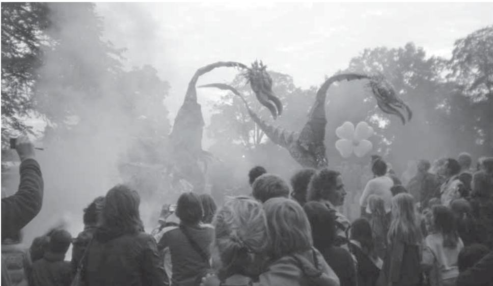
Draken op het grasveld bij de Witte Villa. De groep Close-Act opent het evenement 'Kleur van de Nacht' in Sonsbeek op 20 juni 2009.