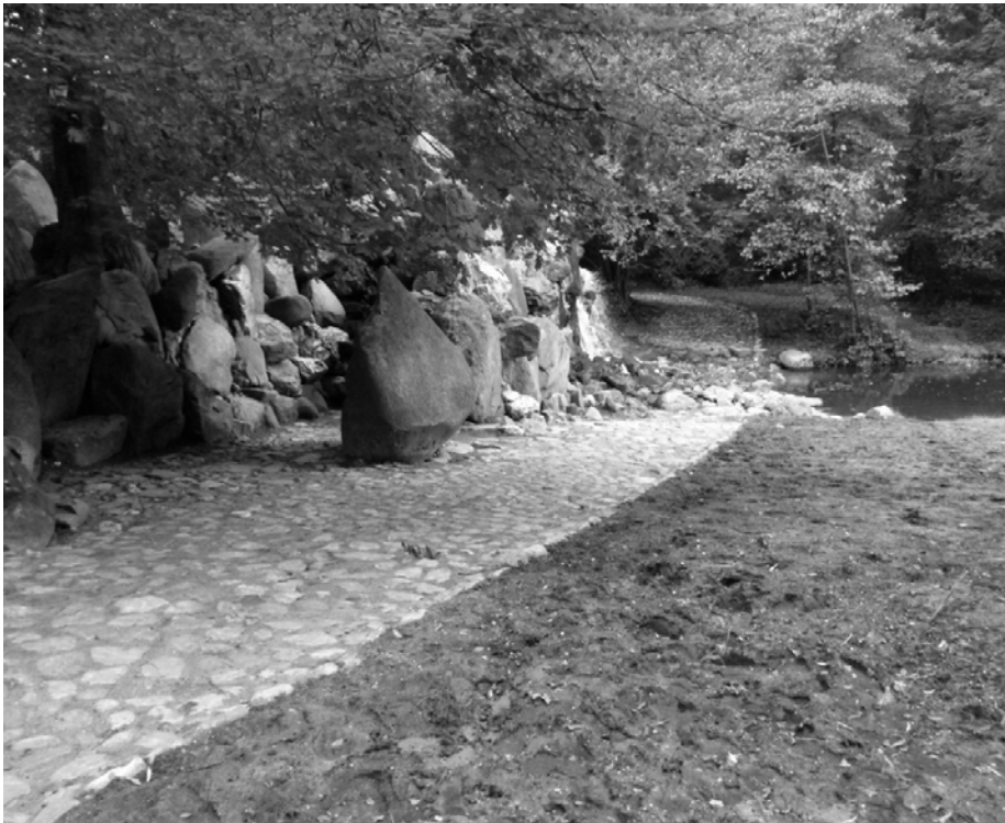
Nieuw: de voorde langs de Grote Waterval.

Vrijwilligers van het IVN hebben deze zomer op een aantal zaterdagen de sprengkoppen in Sonsbeek en Zypendaal opgeschoond. De 'spoelschade' als gevolg van de natte zomer zal in de herfstmaanden worden hersteld. Uw 'rijdende reporter' heeft aan den lijve ondervonden hoe diep op sommige plaatsen de erosiegeulen in de paden zijn. De Karpervijver zal worden uitgebaggerd en in de Fonteinvijver komt een nieuwe fontein.