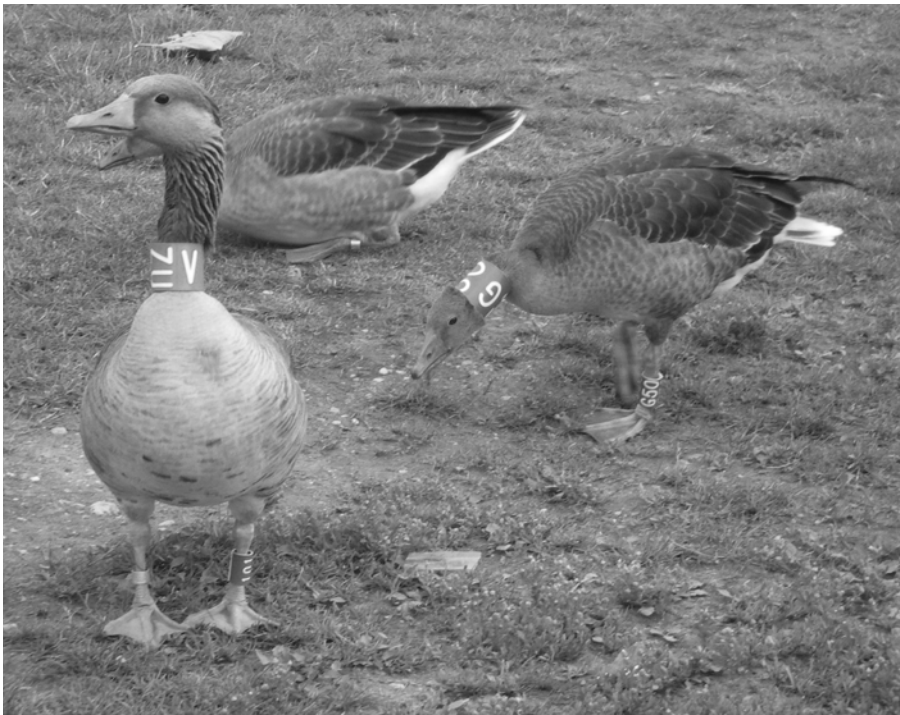
Van de 100 in Sonsbeek geringde Grauwe Ganzen hebben er 30 ook een halsband.