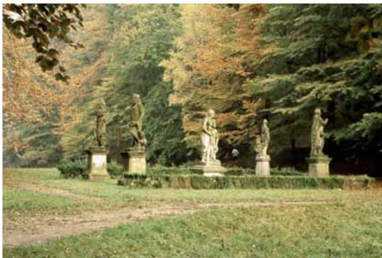
De kwalitatief slechte foto is als historisch document op mijn verzoek toch opgenomen.