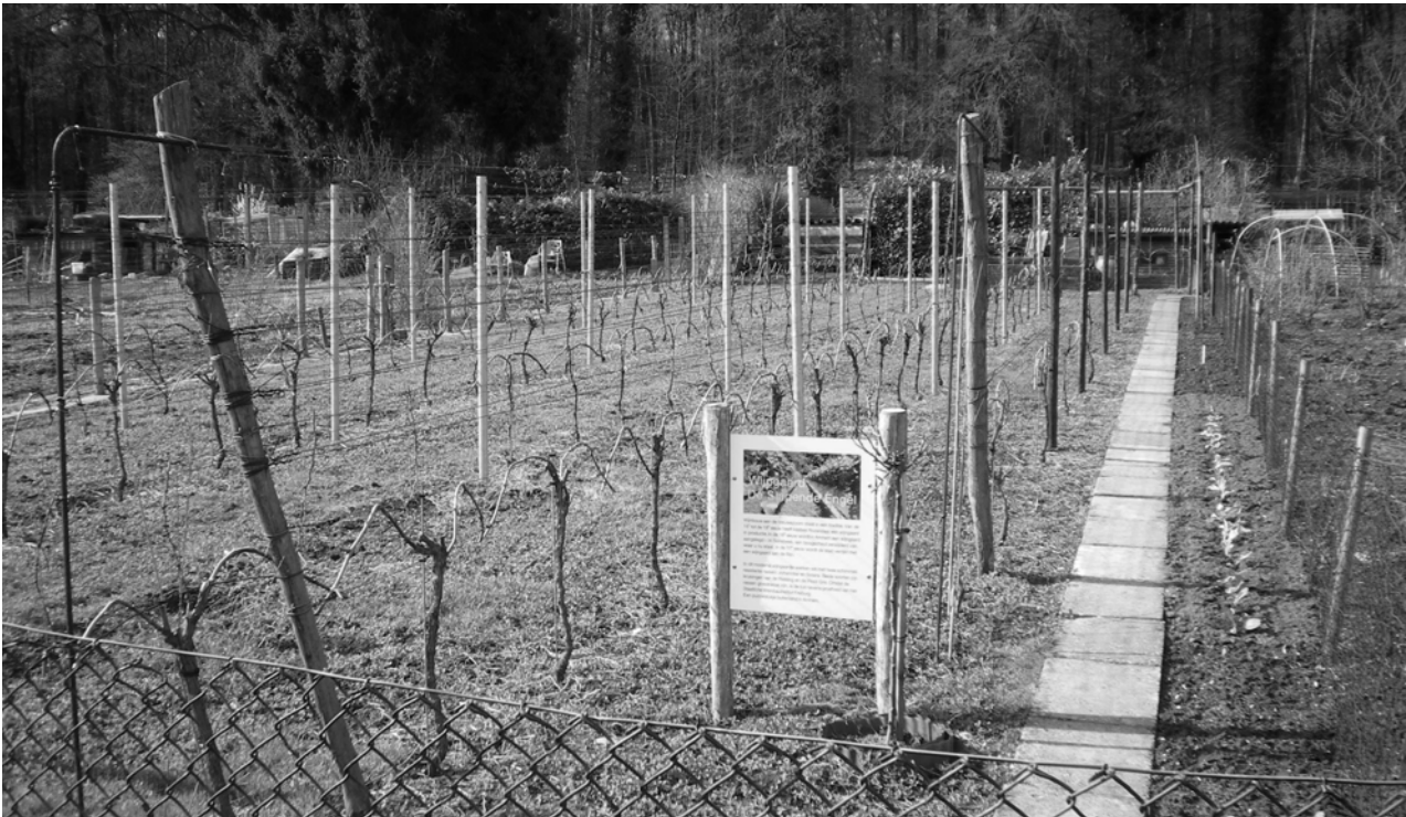
Kleine wijngaard in het complex volkstuinten aan de Parkweg

Met koffie en cake. In 1982 naar de Floriade in Amsterdam. Dat was de laatste keer zo is in ons jubileumboek te lezen. Maar natuurlijk zijn er wel ruilochtenden, af en toe een workshop en een barbecue. En we kopen centraal zaden, poot aardappelen, uien en mest in."