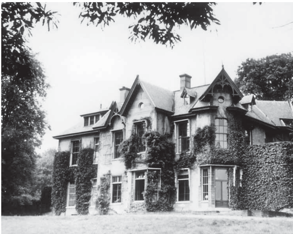
Het Jachthuis op Gulden Bodem omstreeks 1960. Het werd in 1964 afgebroken

Bovendien valt te lezen hoe de landschapsstijl in Nederland geprofiteerd heeft van het inzicht van baron Brantsen.