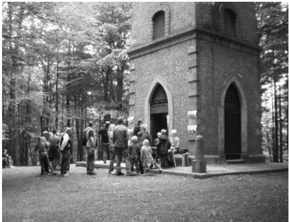
In de rij voor de Belvédère op zondagmiddag