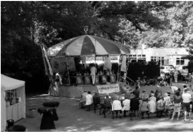
De Big Band uit Veenendaal speelt in de Steile Tuin