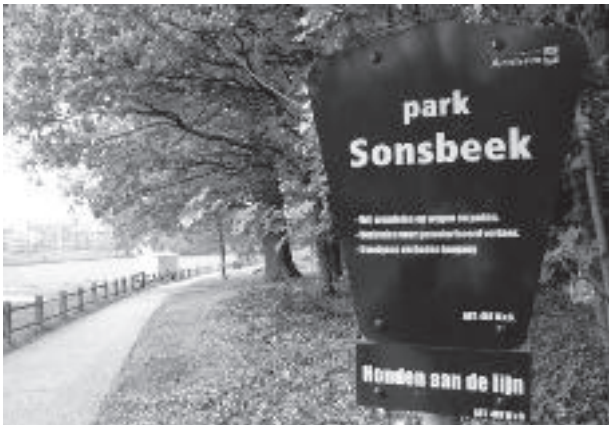
Vrij wandelen op wegen en paden. Verboden voor gemotoriseerd verkeer. Overigens verboden toegang. Honden aan de lijn. ART.461 W.v.S.

velders op een andere plek. We vinden die Grote Weide voor de koeien dus zo belangrijk dat we die een specifieke bestemming hebben gegeven. Dat we dit willen koesteren blijkt bijvoorbeeld uit het feit dat we hier geen evenementen houden zoals elders in het park wel gebeurt. Hoeveel koeienleed wordt er als gevolg van de huidige situatie aangericht? Dat valt wel mee wanneer bezoekers alleen over het pad lopen. Dan ontstaat er alleen maar een soort shared space, dus gebruik van dezelfde ruimte door verschillende partijen. Ik heb nog niet gemerkt dat de koeien er stress van kregen. En er is tot nu toe ook nog geen gevaarlijke situatie ontstaan.