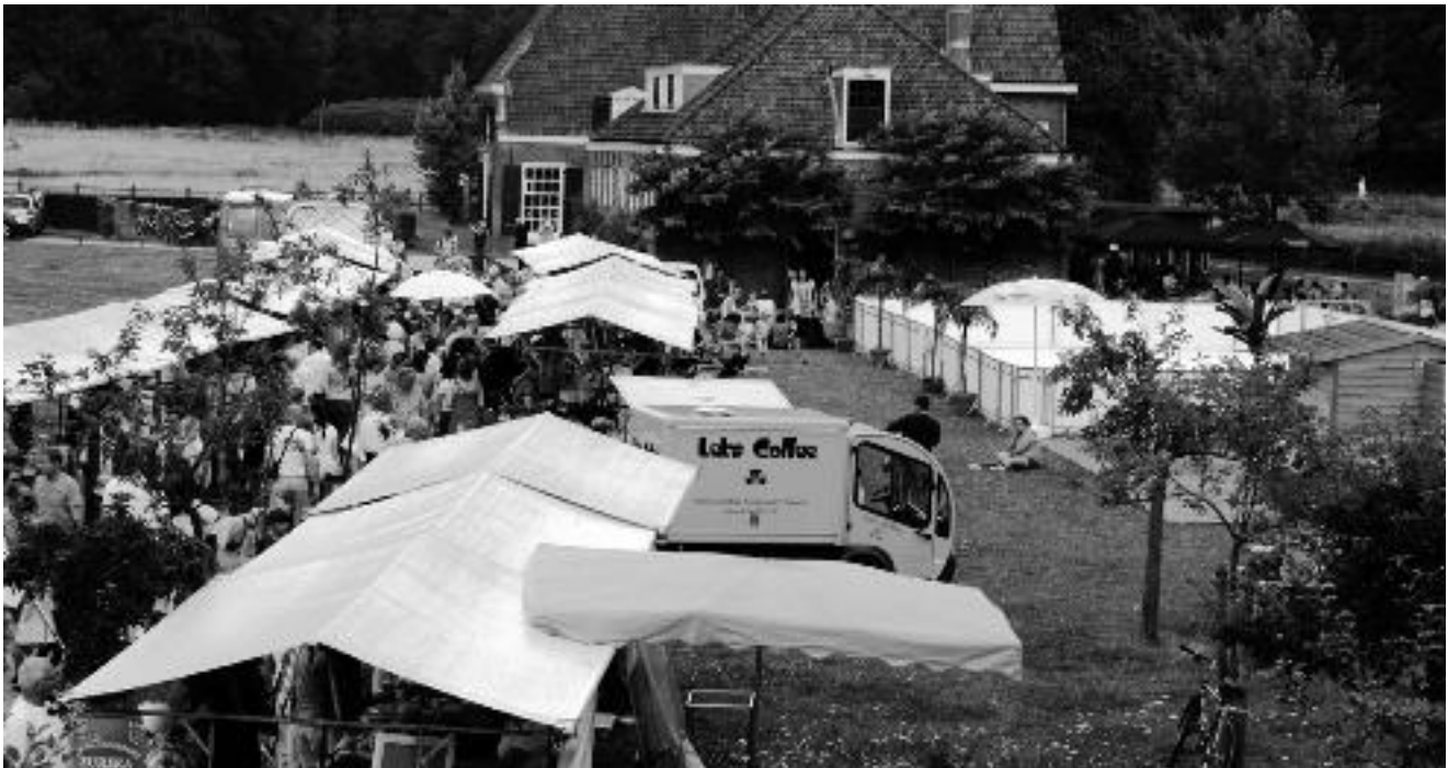
Impressie van de Sonsbeekmarkt op het Jansveld. Foto Gerard Herbers, augustus 2012.