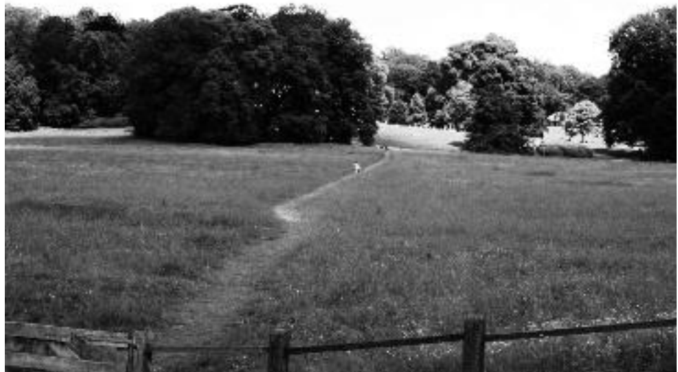
Olifantspad op de Grote Weide.

Maar waarom geen oogje dichtgedaan? Glissenaar: “De weide heeft een duidelijke bestemming. Daar lopen in de zomer voor zeventig procent van de tijd koeien. De overige tijd zijn onze Laken-