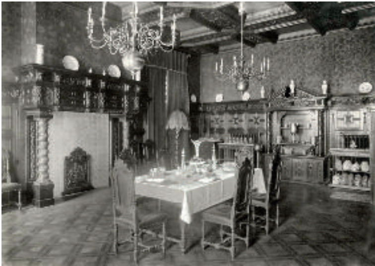
Foto uit 1924 van de eetzaal, ook Ridderzaal genoemd, van Hotel-Pension 'Sonsbeek' - verschenen in het blad 'Het Leven' - collectie Nationaal Archief.

De eerste slechte indruk van de thuissituatie was Schaap daarvoor voldoende.