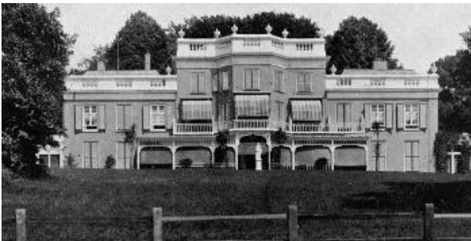
Foto uit 1932 van de complete voorgevel van Hotel-Pension 'Sonsbeek', met het tuinbeeld in het midden van de serre.

De evacuatie van Arnhem in september 1944 betekende het einde van de exploitatie van het hotel door Claassen en ook het einde van 44 jaar Hotel-Pension 'Sonsbeek'. Claassen emigreerde in 1946 met zijn zoon naar Brazilië om daar een nieuw bestaan op te bouwen. Hoewel het hotel van binnen en van buiten in het laatste oorlogsjaar flink is beschadigd, heeft het gemeentebestuur na de oorlog toch besloten het gebouw te behouden voor een andere bestemming.