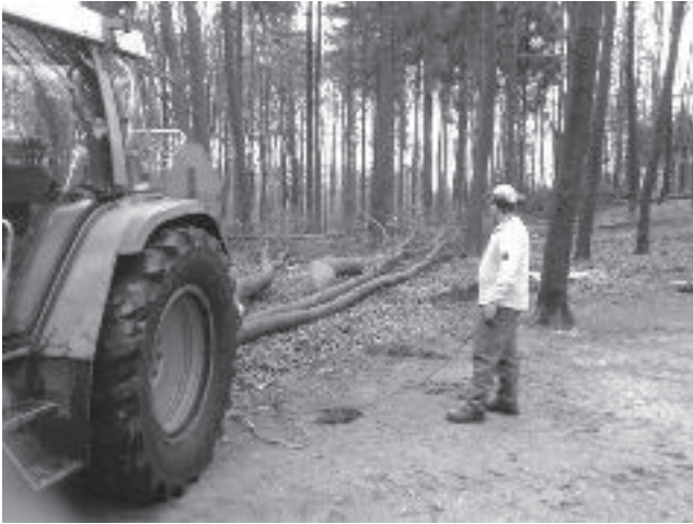
Het wegslepen van omgezaagde bomen rond de Belvédère.

Wandelaars in Sonsbeek moet het wel zijn opgevallen: er zijn flink wat bomen geveld, vooral in de buurt van de Kleine Waterval en rond de Belvédère. Op de eerstgenoemde plaats zijn het vooral oude bomen die al 'geblest' waren. Ze waren aangetast door zwammen. Alleen de stompjes zijn nog zichtbaar.