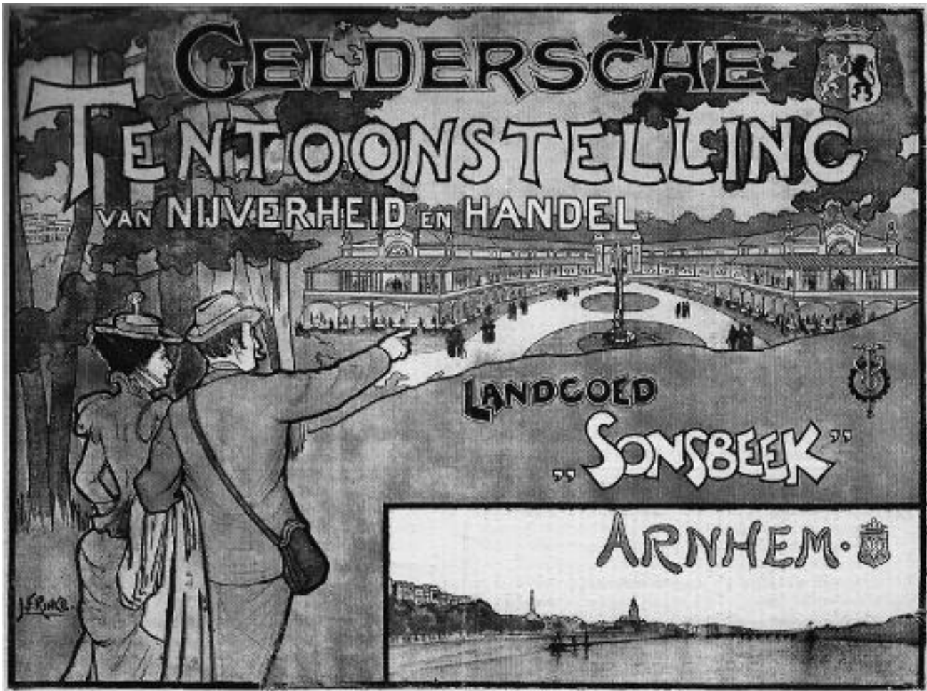
Affiche van de tentoonstelling uit 1897, ontwerp J.F. Rinke

Er was het Openbaar Ministerie blijkbaar veel aan gelegen om de verdachte veroordeeld te krijgen. Tijdens de rechtszaak over 'de geruchtmakende brandstichting-quaestie' die werd bijgewoond door 'een buitengewoon talrijk publiek, zowel op de tribune als in de rechtszaal', werden liefst 43 getuigen gehoord. Om 18 uur werd de zitting verdaagd. De eis van de aanklager was de volgende dag niet mis: acht jaar gevangenisstraf.