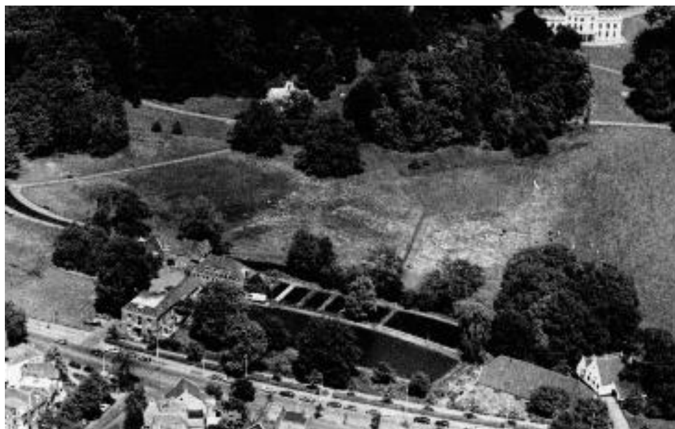
Foto van de Begijnemolen met de hengelvijvers, ca 1985.

Eén van die pachters herinner ik me nog wel. Toen ik midden jaren zeventig in dienst van de gemeente kwam, gingen mijn collega's en ik wel eens een warm gerookt forelletje bij hem eten. Dat kon, want er vielen nog wel eens forellen van het rookijzer en die hadden dan geen handelswaarde meer. Als particulier kon je er ook forellen kopen, maar er werd voornamelijk geleverd aan winkels, hotels en restaurants. De aanvoer van levende forellen gebeurde vanuit Denemarken in grote tanks, die werden geleegd in de vijvers.