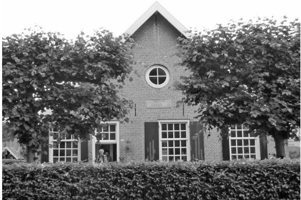
Boerderij Moskowa, Apeldoornseweg 103, Arnhem. Volgens de gevelsteen gebouwd in 1847.

Zo ontstaat boerderij Moskowa, gebouwd in 1847, op het adres Apeldoornseweg 103, en nog steeds in goede staat aanwezig. De boerderij is vernoemd naar de beslissende en bloedige 'Slag bij Borodino' van 7 september 1812. De Fransen noemen het 'Slag bij Moskowa', naar de rivier bij die plaats, en ook wel 'Slag om Moskou' het einddoel van de Ruslandcampagne van Napoleon. In 1873 besluit de gemeenteraad van Arnhem om op de Galgenberg, ten noorden van boerderij Moskowa, een nieuwe gemeentelijke begraafplaats aan te leggen. De naam wordt Moscowa, gespeld met een c (3).