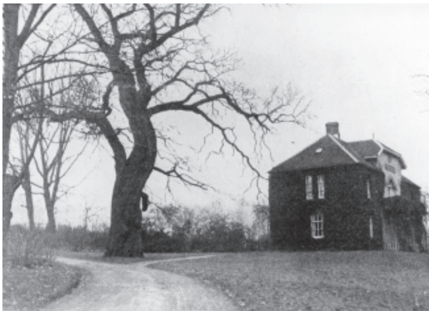
1930 - Het Gulden Spijker, de rentmeesterswoning van Zypendaal