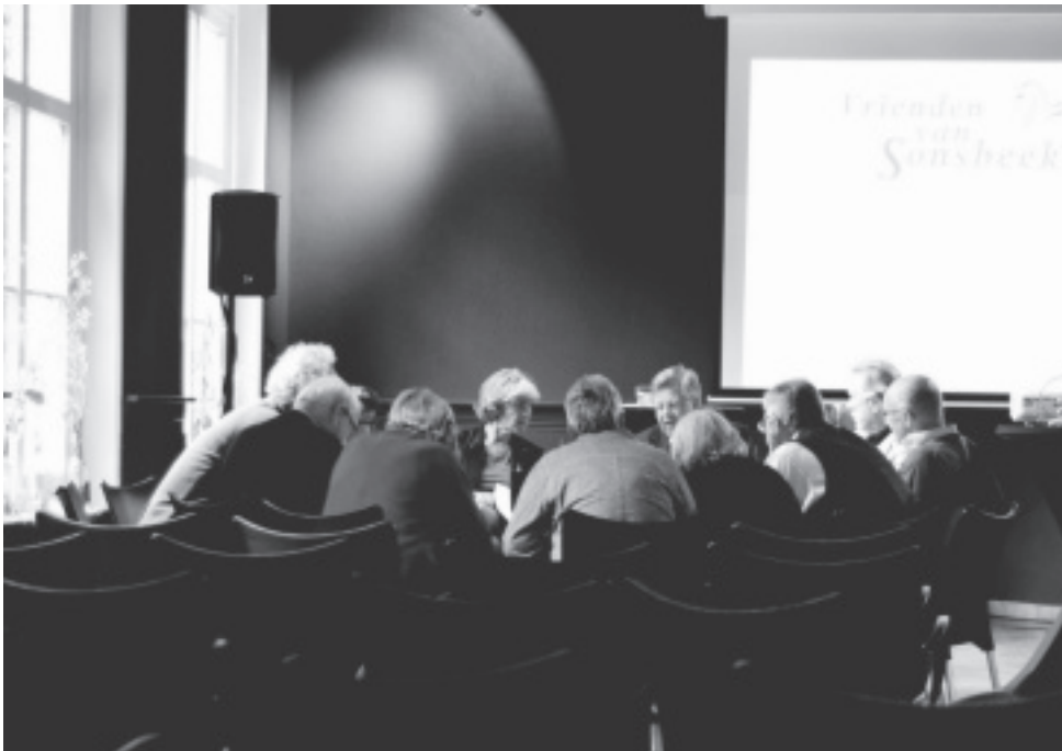
Groepsdiscussie tijdens de jubileumconferentie 'Ons Sonsbeek'.