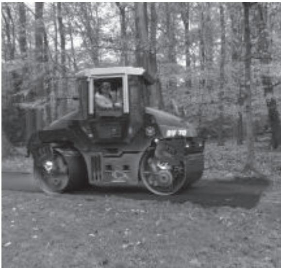
Zware apparatuur, zoals deze wals, was nodig voor het vernieuwen van asfaltpaden langs de beek.

Bezoekers kunnen inmiddels zelf beoordelen of de naamsverandering van 'Bezoekerscentrum Sonsbeek' naar 'De Molenplaats' ook in de inrichting geslaagd is.