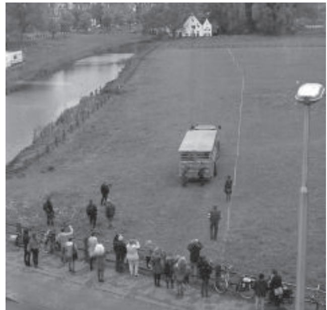
Bij de voorpagina en bij deze foto: op 7 mei heeft het Natuurcentrum alvast 4 koeien in de Grote Weide gezet. Na het maaien van de weide begin juni werden het er 12.