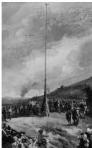
De schutters van de Sint Joosten Doelen schieten op de 'papagaay', rond 1800, GA. De locatie is waarschijnlijk bij de Bicksberg

Hoewel we de Teerplaats nu als boerderij kennen was het oorspronkelijk een plaatsaanduiding die verbonden was aan schutterijen. Dat waren plaatselijke milities die ruwweg tussen 1500 en 1900 steden en de omringende landerijen beschermden. De officieren waren beroeps, de eigenlijke schutters oproepbare vrijwilligers. Deze schutterijen hielden van oudsher schietwedstrijden op het terrein 'de Teerplaats'. Die naam is afgeleid van de term potverteren, waarvan een oude betekenis 'een banket houden met je gildebroeders' is, in dit geval de schutterij. Die hielden zo'n banket na schietwedstrijden, die natuurlijk nogal wat volk trokken. De toeschouwers namen zelf ook hun eigen hapje en drankje mee. Bij de eigenlijke schietwedstrijden poogden de schutters een houten 'papagaay' van een hoge paal te schieten. Zo'n kleurrijke houten vogel was natuurlijk een uitstekend object om als schietschijf te dienen.