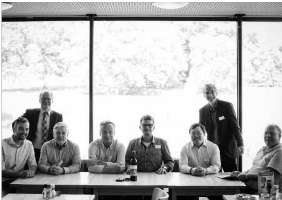
De leden van het Ondernemersverband Sonsbeek

In park Sonsbeek zijn zes horeca-ondernemingen gevestigd: Stadsvilla Sonsbeek, Sonsbeek Paviljoen, Brasserie De Boerderij, De Palatijn, Molenplaats/Bezoekerscentrum Sonsbeek, Brasserie Aquarium/ Nederlands Watermuseum.