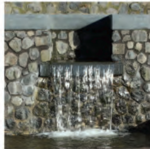
Tijdelijke uitstruom (Rijnkade)