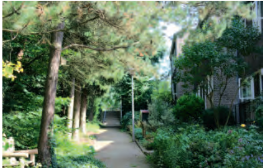
Wonen aan het Loospad in het bos zonder auto voor de deur.

De wegen en voetpaden die uitkomen op de Wolflaan, de grens tussen park Zypendaal en woonwijk 't Cranevelt, vormen even zovele toegangen tot het bos. Deze entrees zijn min of meer gemarkeerd. Overwogen wordt ze duidelijker aan te geven voor het publiek.