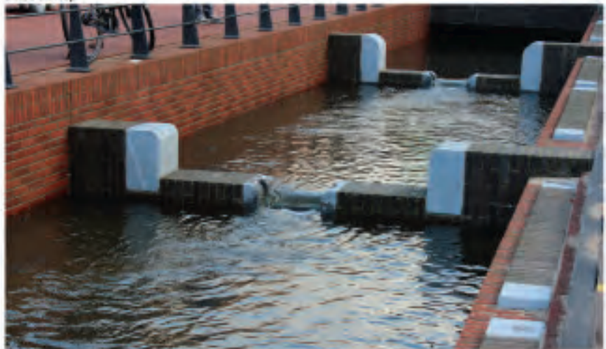
Cascade (Audrey Hepburnplein)