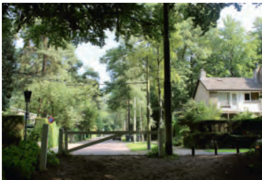
Routes verbinden de woonwijk met het bos, hier de Wolfiaan.

Het karakter van het zuidoostelijk deel, met haaks op de helling georiënteerde woningen, is weer anders. Tussen de woonblokken liggen stroken bos en voetpaden. Deze groene binnenruimtes, zonder de auto voor de deur, zijn hierdoor een verademing. Verder lopen door de hele wijk dwars op de ontsluiting voetpaden en zijn brede stroken bos behouden.