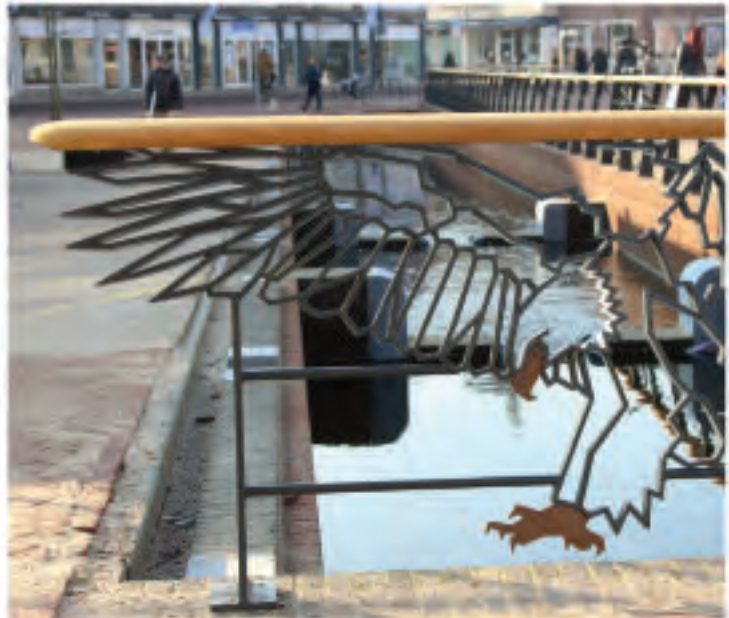
Adelaarsbrug (t.h.v. Bakkerstraat)

In het vorig Bulletin toonden we foto's van de Sint Jansbeek in park Sonsbeek. De diversiteit van de verschijningsvormen vormden inspiratie voor het ontwerp van de bovengronds gebrachte beek. Op iedere plek in het centrum van de stad ziet die er anders uit. Aan het begin in de Beekstraat breed en met waterplanten en kelen. Bij de Eusebiuskerk een gebogen vorm die de toekomstige zijtoegang markeert en aan de andere kant vanaf het terras is er zicht op het water en de oude muur met varens. Het water stroomt daarna langs het nieuwe Focuscomplex, net als bij kasteel Zypendaal. Het smeedsterkwerk van de Vitessebrug is geïnspireerd op de Zwanenbrug in park Sonsbeek. De cascade accentueert het aflopend Audrey Hepburnplein. Aan het eind versmalt de beek en bij de hoge Rijnkade ligt zij diep. Door traptreden en stapstenen is de Sint Jansbeek over te steken, net als bij de grote waterval in het park. De uitstroom in de Rijn wordt na de renovatie van de Rijnkade een open verbinding.