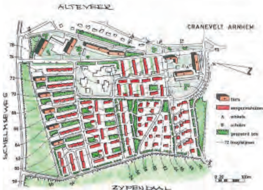
De plankaart van Cranevelt uit 1958.